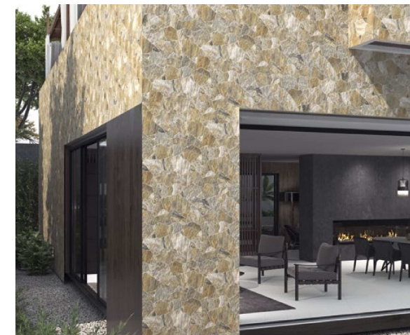
Sella Nature 44x66 cm. · 17"x26"