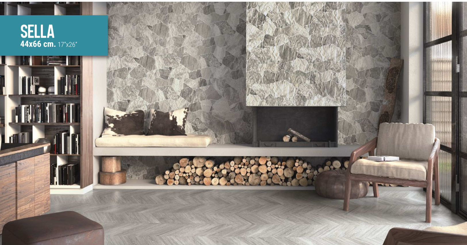
Sella Grey 44x66 cm. · 17"x26" · Pav. Diamond Timber Olive 70x40 cm. · 27,5"x16"