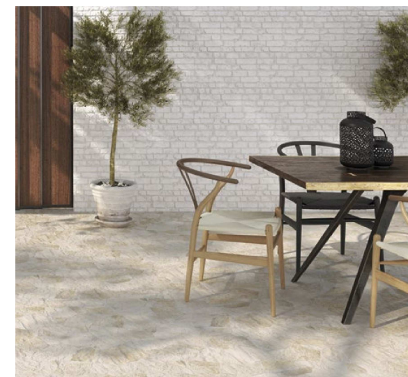
Manhattan Blanco 31x56 cm. · 12"x22" · Pav. Sella White 44x66 cm. · 17"x26"