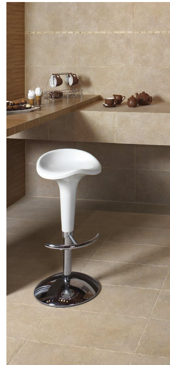
Petra Beige 31x56 cm. - 12"x22"