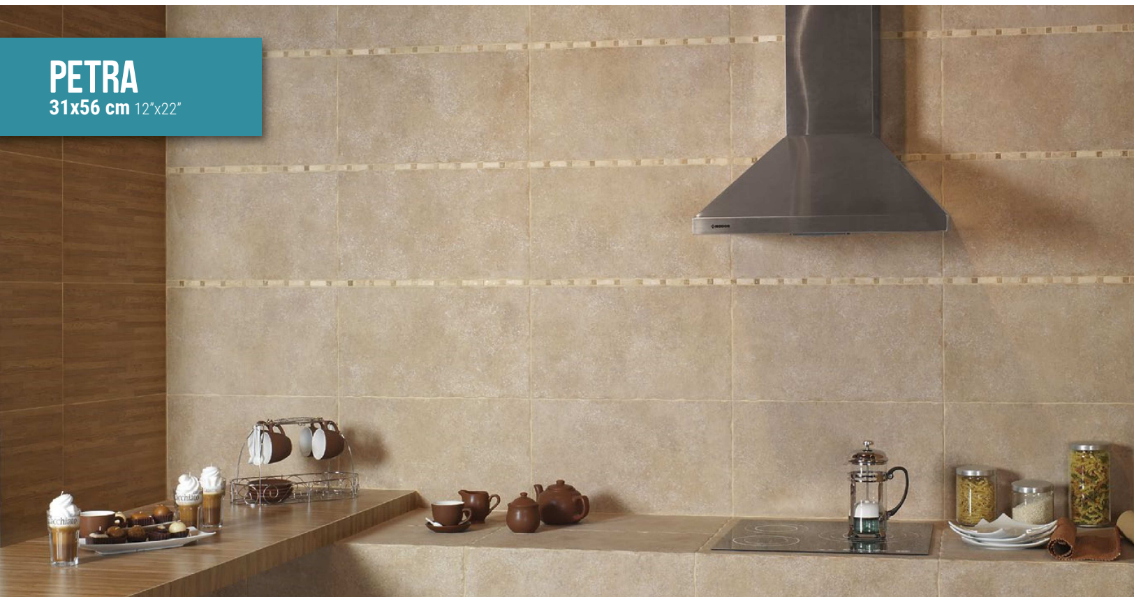
Petra Beige 31x56 cm. - 12"x22"